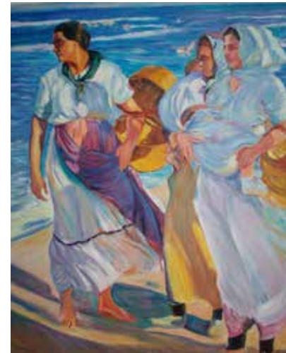
Joaquín Sorolla, Pescadoras valencianas , 1915 (Museo Sorolla, Madrid)

Para compoñer a fotografía revisáronse escenas de praia relativas á pesca pintadas por Sorolla; especialmente Pescadoras valencianas , onde as mulleres son as únicas protagonistas e móstranse recias e decididas.