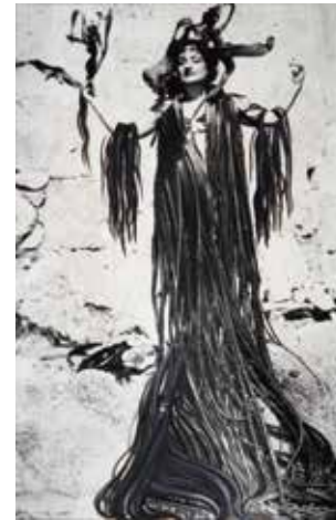
Maruja Mallo con manto de algas nas praias de Chile, cara a 1945 (Galería Guillermo de Osma, Madrid)

Esta instantánea, que se realizou nunha praia de Chile, evoca a imaxe das mulleres transportando algas na cabeza, unha imaxe frecuente nas vilas mariñeiras de Galicia que a artista tivo ocasión de ver durante a súa estancia en Bueu.