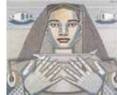
Maruja Mallo, Arquitectura humana , 1937 (Colección particular)

A imaxe compúxose a partir de dúas pinturas de Maruja Mallo que teñen a súa orixe nos debuxos que a artista realizou durante o verán de 1936, recollidos no chamado Caderno de Bueu . Posteriormente, desde o exilio, utilizou aqueles apuntamentos para compoñer as obras Mensaxe do mar , Arquitectura humana e Figuras .