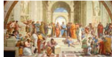
Rafael Sanzio, A escola de Atenas , 1510-11 (Musei Vaticani, Roma)

A fotografía realizouse no auditorio ao aire libre do parque Xosé Novas en Beluso. Recreouse a pintura ao fresco da Escola de Atenas de Rafael na que se representan personaxes destacados dos distintos ámbitos do coñecemento da Antigüidade Clásica. Os dous grandes filósofos, Platón e Aristóteles, están no centro. Ao redor deles, matemáticos, astrónomos ou químicos distribúense formando grupos de discusión. Agás Hipatia de Alexandría, todos son homes, xa que ás mulleres non se lles permitía acceder ao coñecemento.