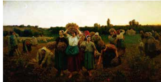
Jules Breton, A retirada das espigadoras , 1859 (Musée d'Orsay, Paris)

A composición da imaxe está inspirada nunha escena representada nunha pintura de Jules Breton na que as “espigadoras” se retiran ao final da xornada.