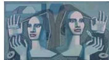
Maruja Mallo, Mensaxe do mar , 1938 (Galería Guillermo de Osma, Madrid)