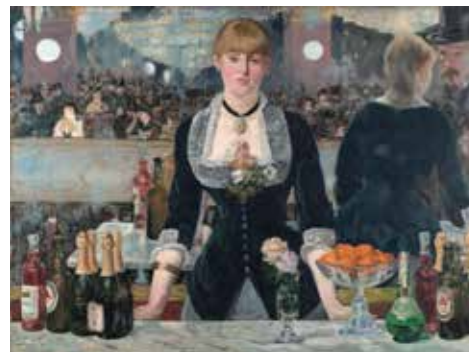
Édouard Manet, O bar do Folies Bergère , 1882 (Courtauld Institute of Art, Londres)

A fotografía alude á pintura O bar do Folies Bergère de Édouard Manet.