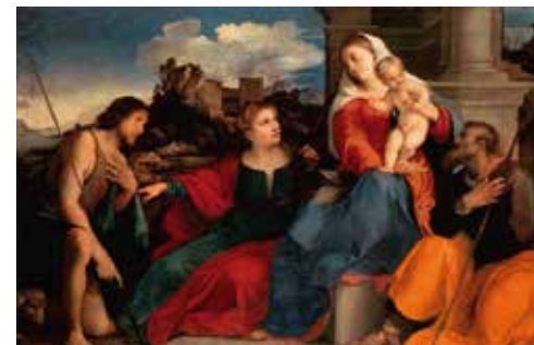
Jacopo d'Antonio Negretti Palma il Vecchio , Sagrada conversación , 1525 (Galerie dell' Accademia, Venecia)

Tomamos como modelo unha pintura co tema da “sagrada conversación” e outra cun faladoiro de intelectuais.