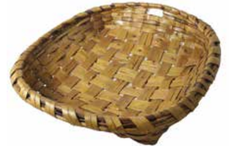
► Patela , primeira metade do século XX. Estas cestas transportábanas na cabeza as mulleres para levar a vender o peixe. Museo Massó.