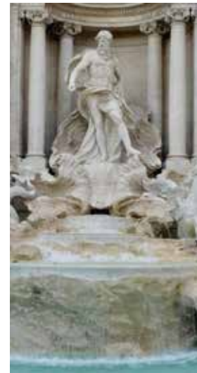
Nicolai Salvi, Fontana di Trevi , 1732 (Roma)

Por outra banda, a manguera evoca a serpe mariña, que é a forma coa que se representaban os seres mitolóxicos que acompañaban a Neptuno.