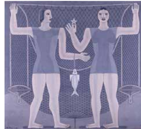
Maruja Mallo, Figuras (da serie A relixión do traballo ), 1937 (Museo Nacional de Arte Reina Sofía, Madrid)

Para esta imaxe tomouse como referencia a pintura Figuras de Maruja Mallo e ten a súa orixe nos apuntamentos que a artista realizou durante o verán de 1936, recollidos no chamado Caderno de Bueu .