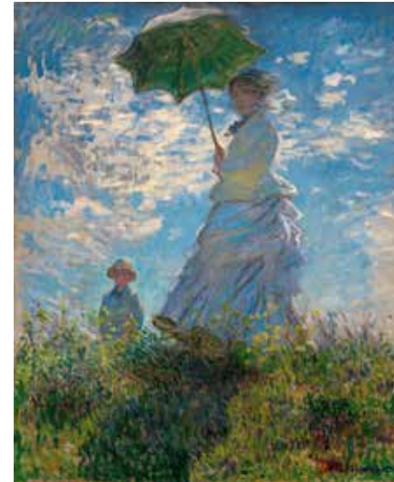
Caude Monet, Muller con parasol , 1875 (National Galery of Art, Washington)

Para a composición desta imaxe baseámonos na pintura Muller con parasol , onde Claude Monet pinta unha escena de paseo campestre.