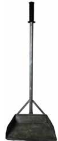
► Recolledor , mediados do século XX. Foi realizado de forma artesanal na fábrica conserveira Massó Hermanos SA. Museo Massó.